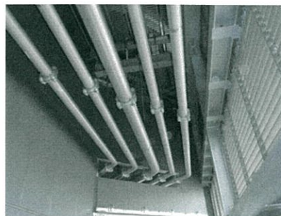
フェライト・ステンレス・プレハブ加工配管 / 施工状況